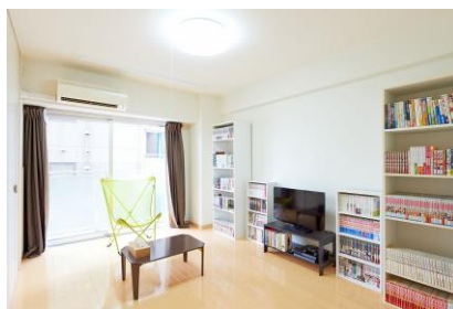
2000 冊のマンガが読める部屋