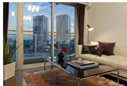
夜景がきれいな部屋